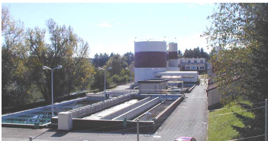
Slika 1: Stara čistilna naprava je preko trideset let služila svojemu namenu, z današnjim dnem pa odhaja v zasluženi pokoj

Z dnem 30.10.2012 je tako tudi prenehala obratovati stara čistilna naprava, od katere bodo zadnji gradbeni sklopi porušeni in odstranjeni v mesecu novembru. Na mestu, kjer je do sedaj še obratovala stara čistilna naprava bodo zgrajeni še dodatni bazeni za čiščenje odpadnih vod, kar bo pomenilo tudi zaključek izgradnje projekta Centralne čistilne naprave v Novem mestu.