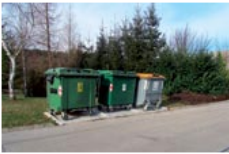
Novi eko otok na Vorančevi ulici`