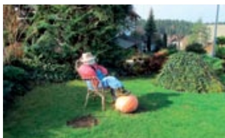
»Možakar« po napornem delu na svojem vrtu