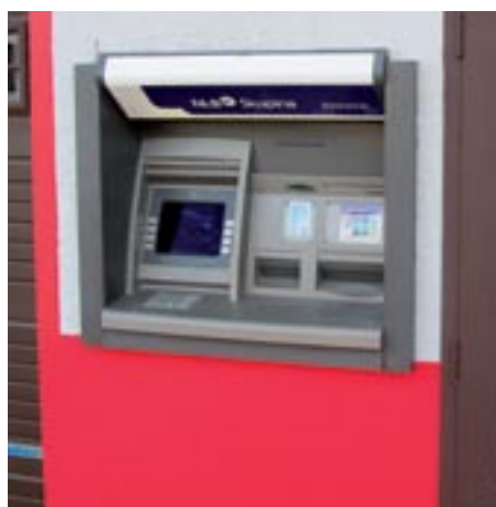
Nov bankomat na gasilskem domu Šmihel

Poleg ceste je zagotovo najpomembnejša pridobitev bankomat, ki je od sredine leta krajanom na voljo na gasilskem domu Šmihel. Pridobili smo ga po dolgotrajnem, na trenutke mukotrpnem prepričevanju bank. Naši gasilci so pri tem pokazali veliko razumevanje, saj so morali za to odstopiti 4 m 2 metre dragocenega prostora v domu, v garaži. Morda se zdi zadeva postavitve bankomata enostavna. Vendar politika bank je danes takšna, da se zelo neradi odločajo za postavitve novih bankomatov, če pa že, ne dajo nobene najemnine oziroma odškodnine. Torej bankomat imamo. Da dokažemo banki, kako je bil potreben, apeliramo na vas, drage krajanke in krajanj, da ga koristite kar v največji meri.