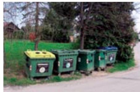
Stara lokacija na Krallovi, ki smo jo prestavili.