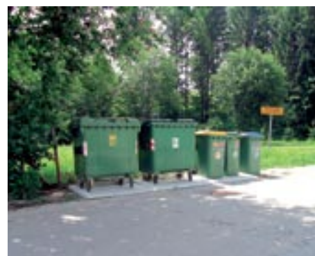
Urejena lokacija eko otoka na Nahtigalovi ulici