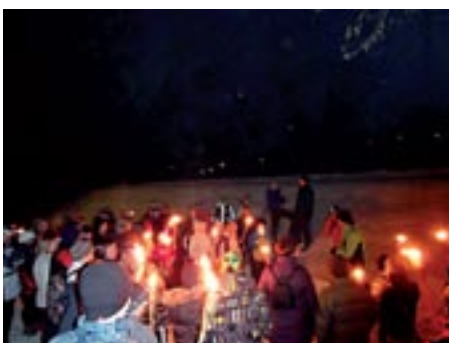
Preko gozda se je vila dolga osvetljena kolona pohodnikov, bilo je res romantično, saj je tik pred tem zapadel sneg.