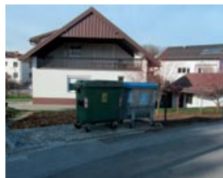
Nova lokacija na Krallovi