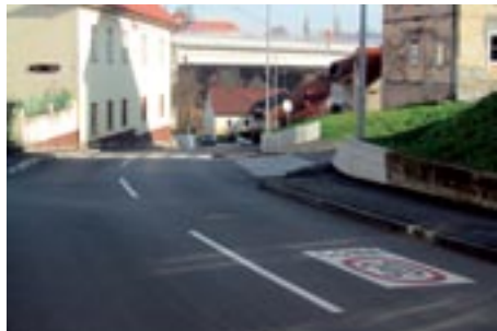
Nova Smrečnikova cesta s pločniki, javno razsvetljavo in vso energetsko in TK infrastrukturo v zemlji

Obnova Smrečnikove ulice od križišča s Šmihelsko cesto do vrtnarije je potekala od začetka meseca februarja do 24. junija 2011, ko je po njej stekel promet.