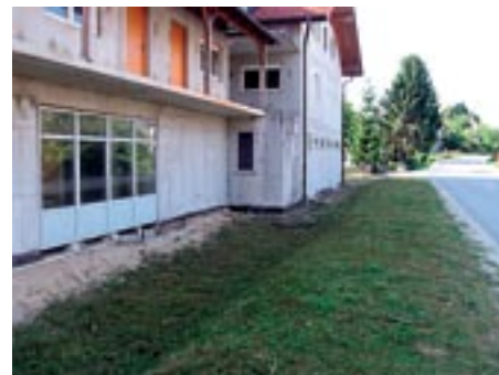
Nekoliko bolj kultivirana okolica po očiševalni akciji gasilcev okrog objekta.

Le upamo lahko, da bo objekt kmalu zaživel in bil s ponudbo in urejeno okolico v ponos krajanom.