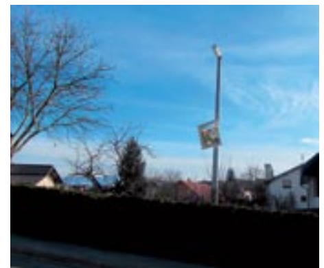
Namestili smo nova ogledala na Krallovi in na Nahtigalovi ulici.

Po kraju smo namestili nekaj novih ogledal.