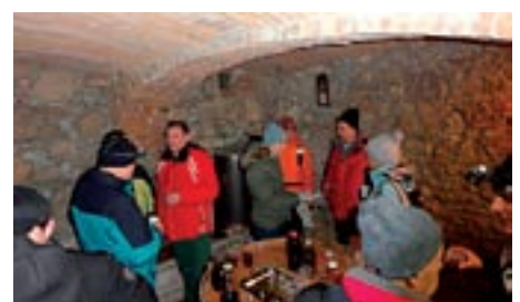
Pripravili so tudi obloženo mizo dobrot, gospodar pa nas je povabil v prekrasno klet