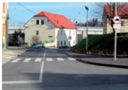
Ozek, nefunkcionalen in nevaren nov uvoz na Smrečnikovo ulico

po predvidevanjih uredil skupaj z mostom čez potok Težka voda, predvidoma v letu 2013.