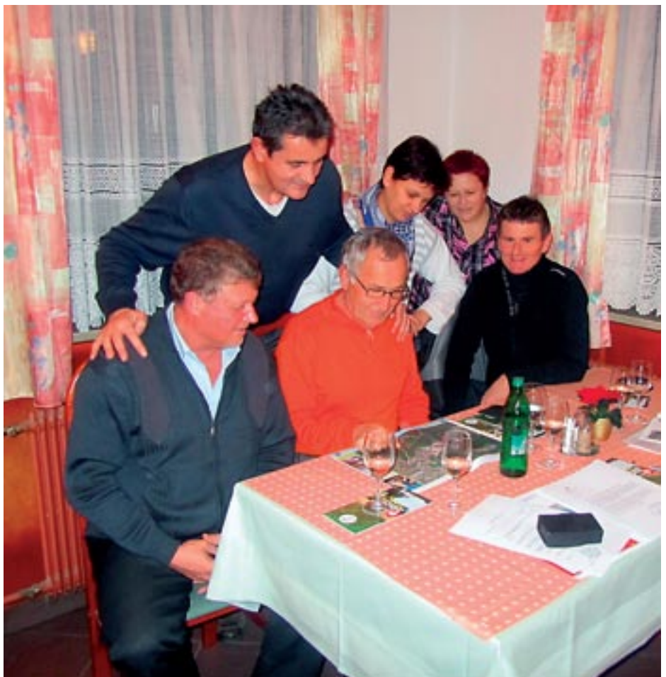
Člani Sveta KS pri svojem delu

V nadaljevanju poročamo o delu Sveta KS Šmihel za leto 2011. Glede na skromna finančna sredstva in majhna pooblastila, ki jih imamo, ocenjujemo, da smo bili kljub temu uspešni.