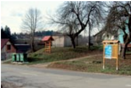
Eko otok v vasi Škrjanče, kjer smo namestili še info tablo in kozolček.