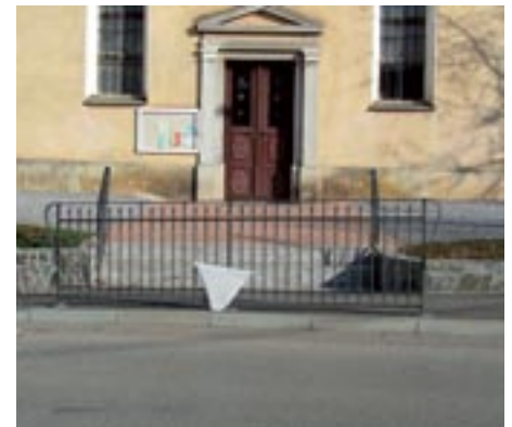
Cerkev sv. Mihaela v Šmihelu, ki je prva pristopila k odprodaji zemljišča ima tudi urejen pločnik in lepo kovano ograjo.

Žal v KS nimamo finančnih sredstev niti možnosti, da si uredimo cesto, kakor nam vsem skupaj najbolj ustreza, zato nam preostane še naprej le prosjačenje, da se občina loti resnejše tega problema.