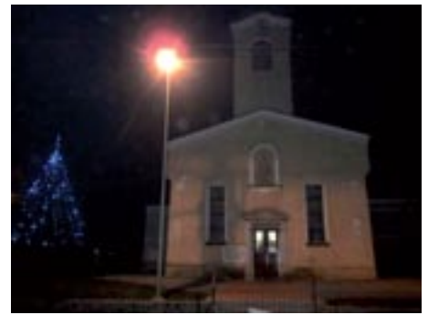
Jelka v modrem

postavimo jelko in jo okrasimo z lučkami. Želja je bila, da bi morda bilo vse v modri barvi, tako lučke na jelki kot morda tudi zunanja osvetlitev cerkve z obstoječimi reflektorji. GG Novo mesto nam je poklonilo krasno košato jelko pripeljano iz naših vršacev, firma Malkom je postavila betonski podstavek, gasilci (res so zlati fantje, vedno pripravljene na pomoč) pa so pomagali s postavitvijo jelke. Lučke lahko v večernem in nočnem času občudujemo že od 7. decembra. Žal pa nam osvetlitev zunanosti cerkve ni najbolj uspela. Na reflektorje smo namestili modro steklo, vendar javna razsvetljava, ki iz varnostnih razlogov osvetljuje pločnike in prehode čez cesto »poje« vso modro barvo naših reflektorjev, tako da bo potrebno v prihodnje poiskati drugo tehnično rešitev. Že sedaj pa za drugo leto v sodelovanju z Župnijskim uradom Novo mesto - Šmihel in Konservatorijem za glasbo Jurij Slatkonja iz Šmihela napovedujemo nadgradnjo letošnjih božičnih dogodkov, ki bodo še bogatejši.