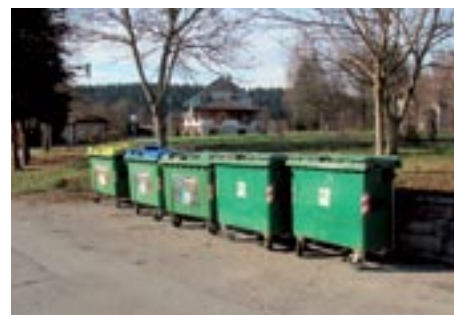
Nova lokacija na Krallovi