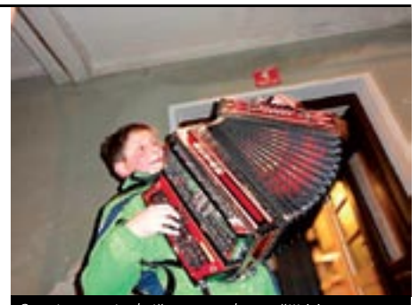
Sprejem najmlajšega na domačiji Mrvar na Boričevem