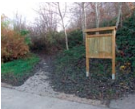
Tako dotrajano so izgledale dosedanje info table. Tabla na sliki ob vstopu na Košenice je bila tudi zaraščena z robido in grmičevjem, kar smo uredili. Na tej lokaciji smo poleg nove table obrezali grmičevje, robido in utrdili ter uredili pešpot, bližnjico do Šmihela.