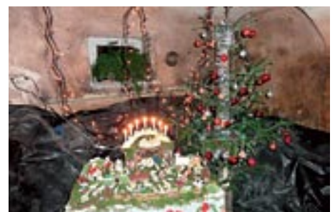
Jaslice, ki so jih za nas pripravili na domačiji Mrvar.