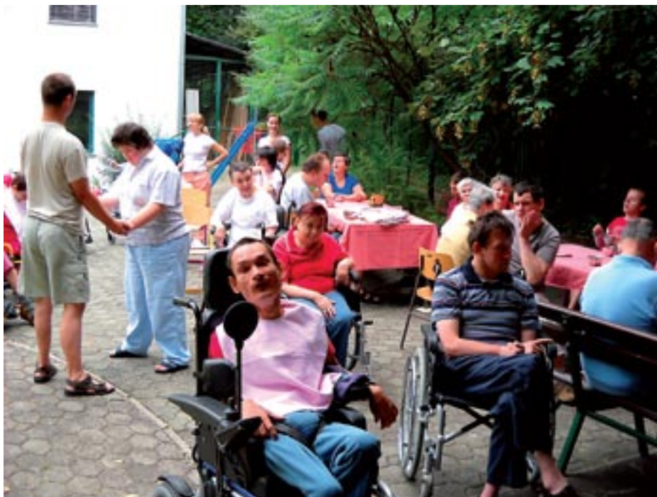
Letošnji piknik pri zavodu

smo sicer pregradili na pol, da smo dobili še eno delavnico, vendar je to le začasna rešitev. Žal nimamo blizu nobene zelenice, da bi naši varovanci lahko šli malo ven. Na srečo pa smo se dogovorili za postavitve ležečega policaja, ker je tam zelo veliko prometa in kamionov in je varovancem težko zagotoviti varnost.