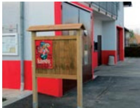
Nova info tabla pred gasilskim domom

Na vpadnicah v našo KS smo postavili dva kozolčka in nanju namestili cvetje. S tem izražamo neke vrste dobrodošlico. Tudi na kozolčke moramo namestiti še napise.