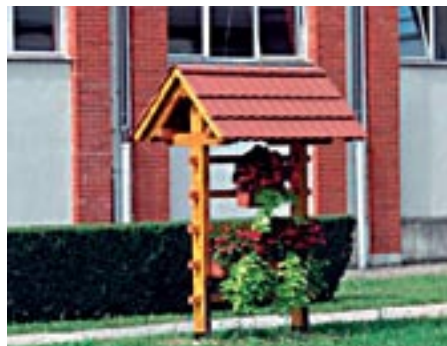
Kozolček s cvetjem pri OŠ

Na vpadnicah v našo KS smo postavili dva kozolčka in nanju namestili cvetje. S tem izražamo neke vrste dobrodošlico. Tudi na kozolčke moramo namestiti še napise.