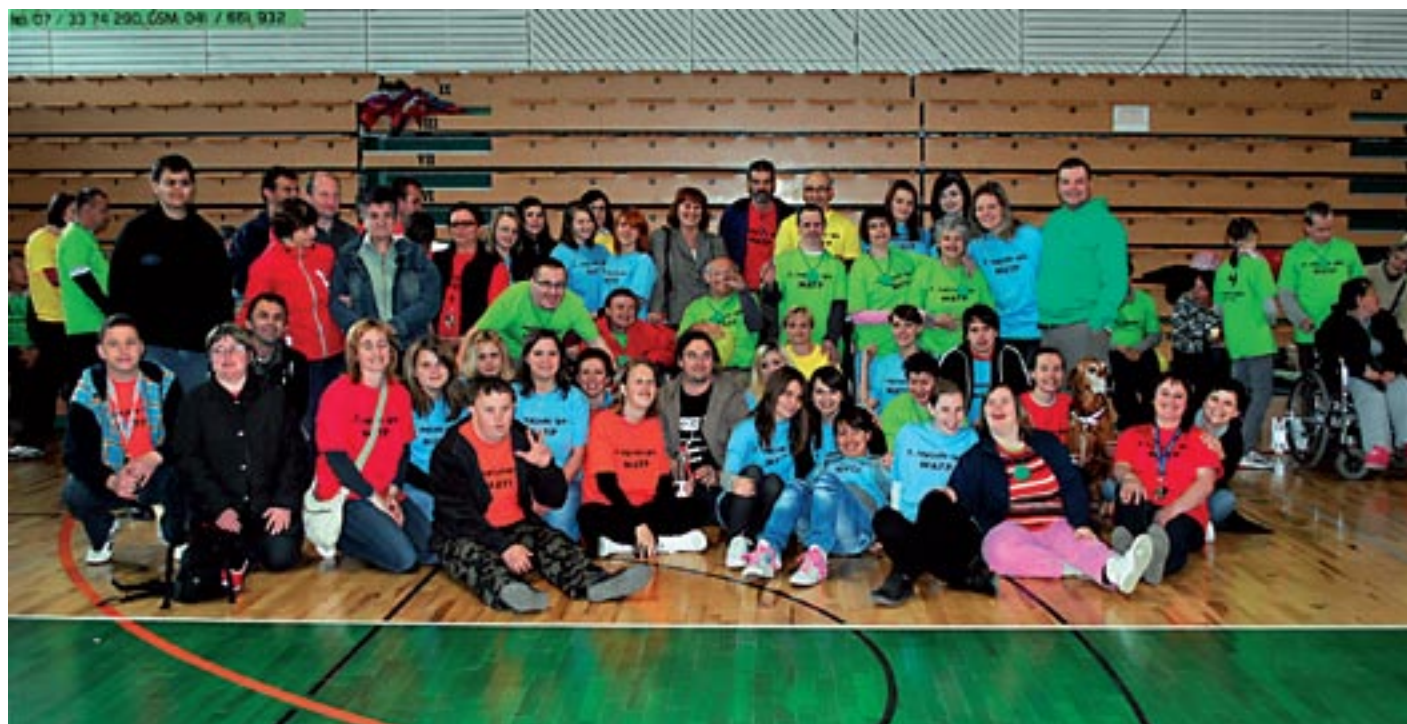
Iz letošnjega MATP – to je del Specialne olimpijade, namenjene najtežje prizadetim, ki ga je VDC letos spomladi organiziral v Novem mestu v dvorani Leona Štuklja.

Mi smo že v decembru 2010, ko sem prišla na to delovno mesto, ugotovili, da imamo v Bršljinu v bivšem Novoteksu že pretesne prostore, ki smo jih odprli leta 2009. Skladišče