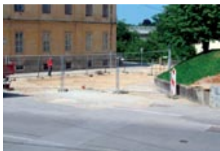
Cesta v fazi gradnje, ko smo z dopisom in predlogi za rešitev še pravočasno opozarjali investitorja, da projekt ne rešuje primerno celostne podobe in funkcionalnosti zemljišča ob roba pločnika.

Cesta je bila nevarna za pešce, nič manj za kolesarje, pa tudi z avtomobilom tu vožnja ni bila prijetna. Sedaj imamo lepo speljano in urejeno cesto s pločniki, javno razsvetljavo ter žal novo cesto z napako. Križišče je preozko! Staro je bilo široko in v križišču so se razvrstili trije avtomobili. Projektna rešitev uvoza s Šmihelske ceste na Smrečnikovo ulico ni dobra. Projekt tudi ne rešuje primerno celostne podobe in funkcionalnosti zemljišča, saj smo poleg ozkega – nevarnega uvoza, kjer se lahko sedaj zvrstita le dva avtomobila, dobili tudi nefunkcionalno ter neestetsko širok pločnik proti škarpi pod brežino cerkve.