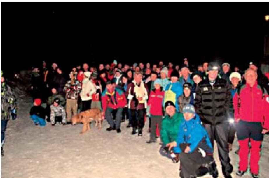
Še zadnji napotki in opremljeni z baklami in svetilkami se odpravimo na pot.