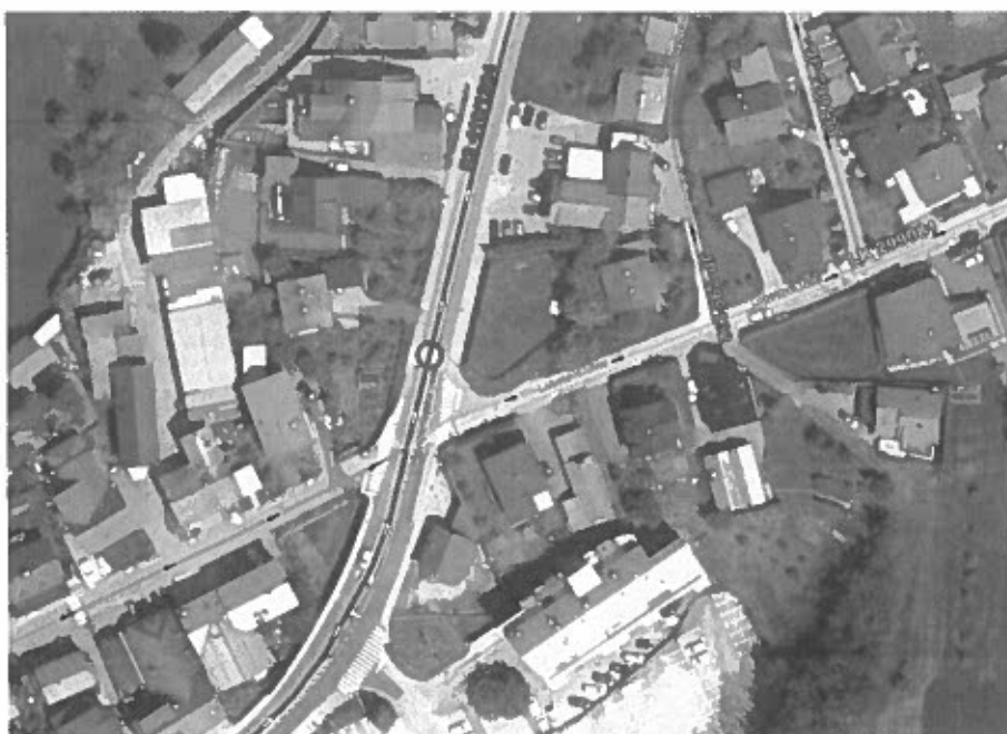
Slika 1: prikaz mikrolokacije merilne naprave Viasis

Podatki so bili zbrani s pomočjo prikazovalnika hitrosti Viasis 3030. Mikrolokacija naprave v času izvajanja meritev: regionalna cesta R2-419/1204, Novo mesto – Šentjernej, v km 0,295. Omejitev hitrosti je 50 km/h. Obdelava zajetih podatkov je narejena za mesec januar 2023. V poročilu o izvedenih meritvah se osredotočimo predvsem na kazalnike, ki so povezani s hitrostjo vozil, manj na strukturo prometnega toka in obseg prometa. Izmerjene vrednosti so za vozila, iz smeri Cikava.