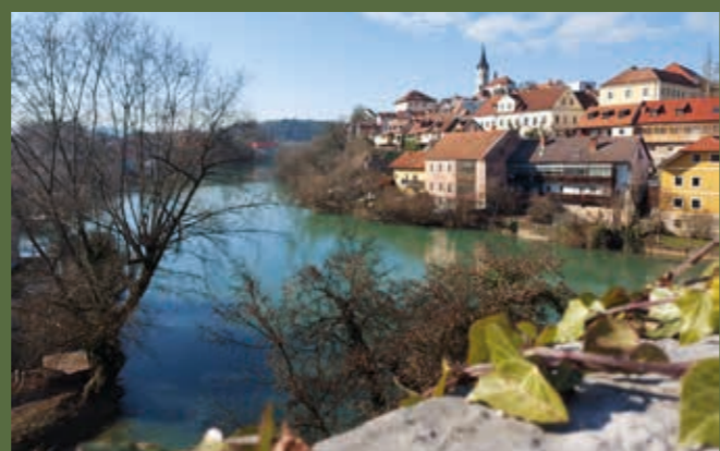
Pomladni žarki že prebujajo Novo mesto in Krko v njunih najlepših barvah.