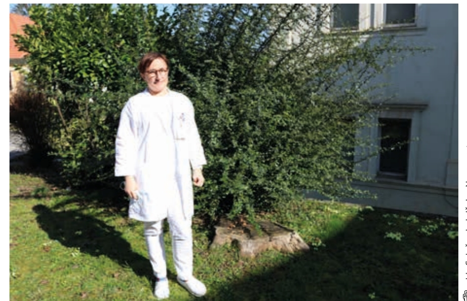
arhiv Splošna bolnišnica Novo mesto

napovedi in obvestila Agencije Republike Slovenije za okolje o kakovosti zraka ter temu prilagodimo svoje aktivnosti. Ob povečani količini trdih delcev v zraku, kot sta inverzija in požar, ne odpiramo oken in uporabljamo zaščitne maske. V času največje onesnaženosti omejimo bivanje na prostem, izogibamo se zadrževanju v bližini prometnic, izberimo raje park ali gozd. Bivalne prostore prezračimo, ko je onesnaženost zraka v dnevu najnižja. Kronični pljučni in srčni bolniki naj redno prejema svojo predpisano terapijo in naj imajo pri roki zdravila za lajšanje napadov oziroma poslabšanj. Pospešen srčni utrip, pomanjkanje sape ali neobičajna utrujenost lahko napovedujejo poslabšanje bolezni, zato je potrebno pravočasno poiskati zdravniško pomoč.