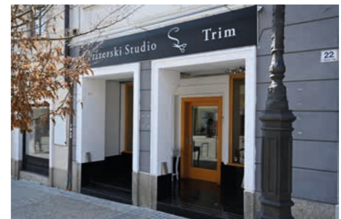
Frizerski studio Trim