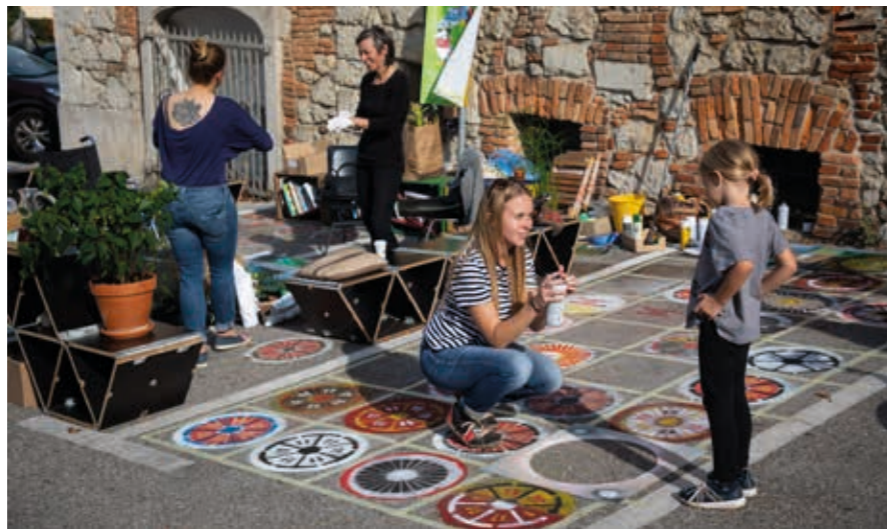
Park(iri)ni teden 2020 v Novem mestu je že peto leto zapored potekal med 16. in 22. septembrom. Namesto parkiranih avtomobilov so lani poleg rednega programa izvedli delavnico za otroke, delavnico sajenja in izmenjave potaknjencev ter ulični koncert. ☺ Boštjan Pucelj

Naše Novo mesto, umeščeno med mehko pokrajino gričev in reko, je vsekakor čudovito. Zato se moramo na eni strani vprašati, kako to lepoto ohraniti za znanjce in na drugi, kako mesto razvijati, da bo sprejemljivo za vse prebivalce, tudi za živali in naravo. Ko se lotevamo urejanja skupnega, so kompromisi in konsenzi nujni, saj ta prostor uporabljamo vsi, torej tudi starejši, otroci, ne nazadnje tudi mestna drevesa ... Mar ni ob prebujanju pomladi čudovito v našem mestu slišati toliko ptic? In kaj bi slišali, če dreves ne bi bilo?