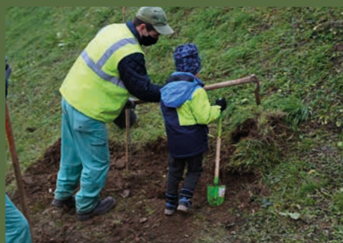
Sprehajalce na Šance ne vabi več samo srednjeveško obzidje, temveč tudi novi dreved avtohtonih drevesnih vrst breka in skorša.