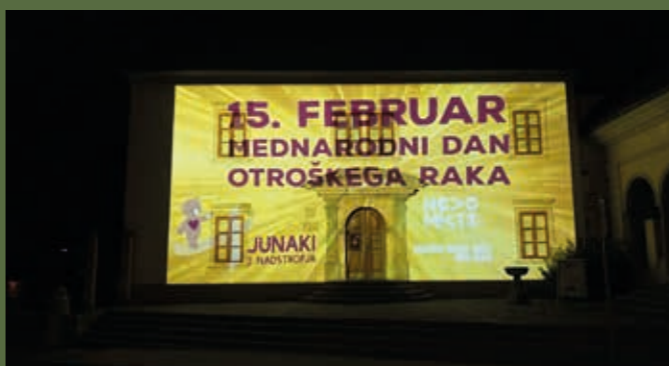
Junakom 3. nadstropja smo se ob mednarodnem dnevu otroškega raka poklonili z zlato projekcijo na Knjižnico Mirana Jarca.