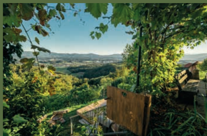
Vsako soboto in nedeljo se lahko med 9. in 19. uro odpravite na Trško goro v Odprte zidanice, kjer vas bodo prevzeli čudovita narava in osupljivi pogledi na dolino.