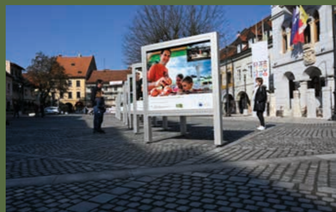
Sredi Glavnega trga je svoje mesto našla razstava Evropska sredstva povezujejo, Novo mesto pa je na njej zastopala fotografija prenovljenega Kandijskega mostu.