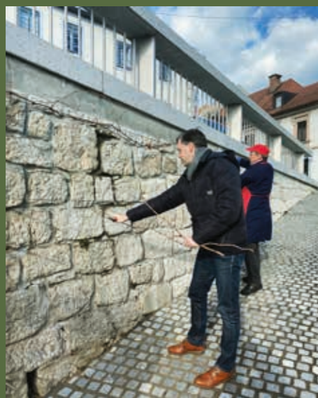
Predstavnica vinorodnega Novega mesta je v mestnem jedru na praznik ljubezni prestala tradicionalen valentinov rez.