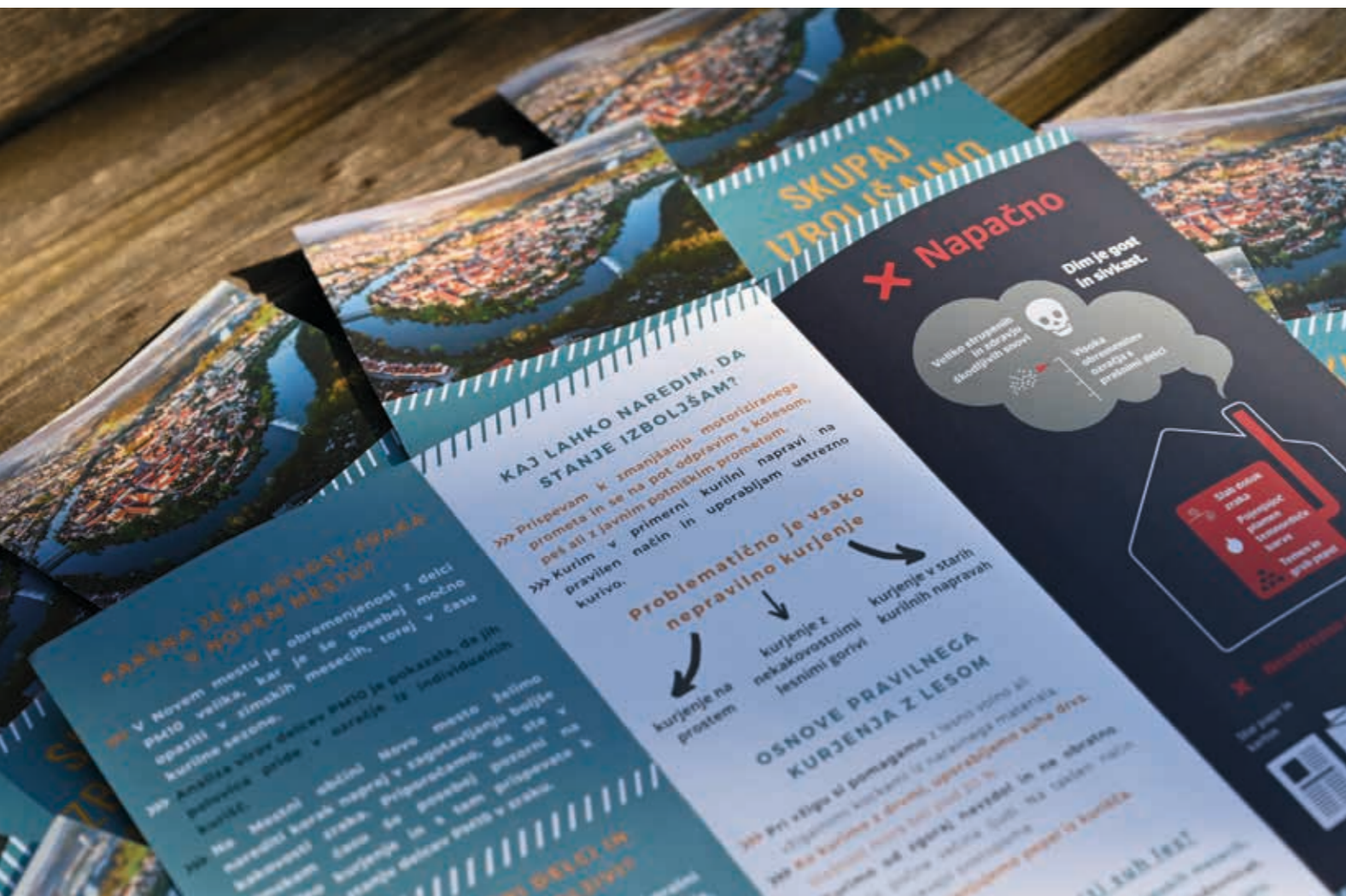
Letak Kakovost zraka

Uspešno smo izpeljali projekt Kakovost zraka, katerega cilj je bil osveščanje občanov o kakovosti zraka v Novem mestu, njegov osrednji poudarek pa je bil na obremenjenosti zraka z delci PM10 in problematiki nepravilnega kurjenja v zimskem času. Občani ste na domove prejeli letake s sloganom Skupaj izboljšajmo kakovost zraka, ki ga dihamo, več strokovnih vsebin smo delili tudi na naši spletni strani.