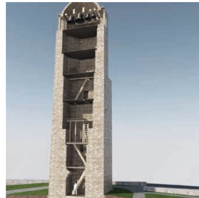
Render Kapitelj pred prenovi