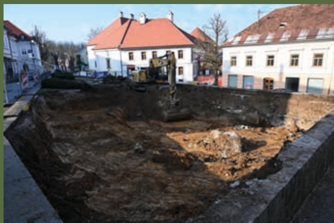
Med Rozmanovo ulico in ulico Prešernov trg nastaja atraktivna ploščad, kjer bo mogoče gostiti manjše dogodke ter posedeti pod drevesi na ozelenelih kaskadah.