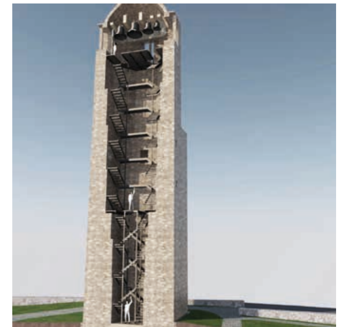
Render Kapitelj po prenovi