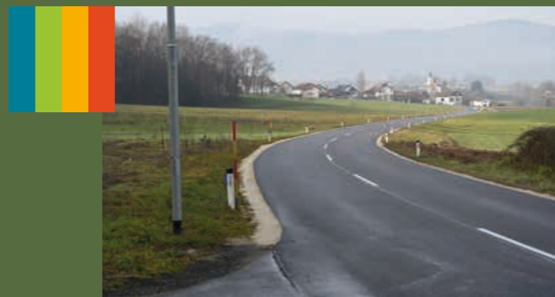
Vijugasta pot do Srebrnič je s sanacijo cestišča postala bistveno bolj varna in prijetna za vožnjo.