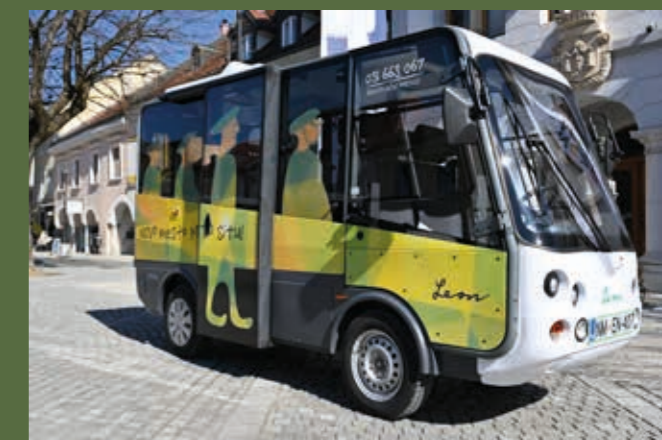
Odličen predstavnik trajnostne mobilnosti, novomeški Leon, je doživel preobrazbo in se odel v barve mesta situl.