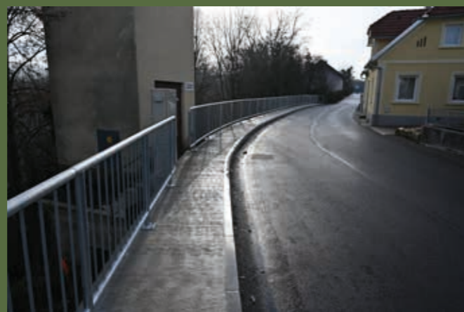
Po delni prenovi prometne ulice Ob Težki vodi se lahko zapeljete po razširjenem cestišču ali sprehodite po novem pločniku.