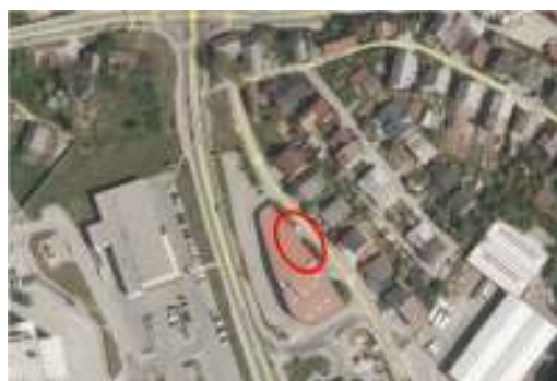
Slika 2: Prikaz območja predvidene pozidave