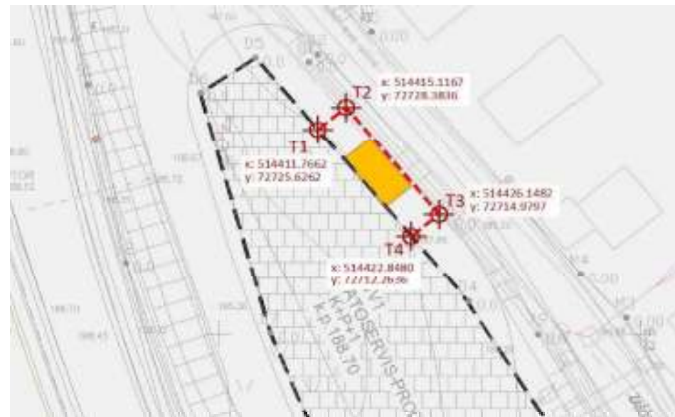
Prikaz načrtovanega prizidka na izseku iz veljavnega zazidalnega načrta ter prikaz koordinat, ki določajo območje odstopanja od dovoljene gradbene linije (črno črtkano)