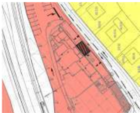
Slika 3: Prikaz načrtovanega prizidka in preureditve manipulacijskih površin na izseku in OPN

dejavnosti (dostava, raztovarjanje ponoči oziroma v zelo zgodnjih jutranjih urah) prihaja do povečanega hrupa in zato motenj v stanovanjskem okolju v neposredni okolici Mesnega centra.