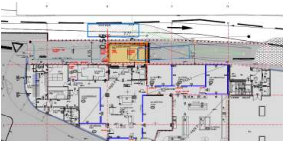
Prikaz načrtovanega prizidka ter preureditve manipulacijskih površin (Studio Kalamar, oktober 2019)