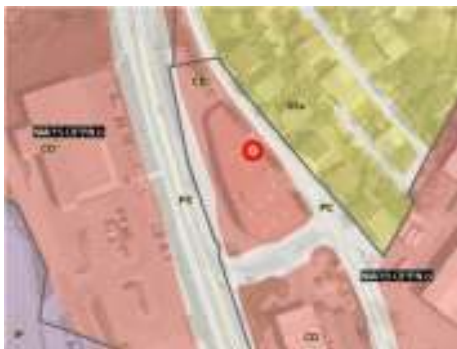
Slika 1: Izsek iz veljavnega OPN MONM

Mestna občina Novo mesto vodi postopek priprave sprememb in dopolnitev Zazidalnega načrta za poslovno oskrbni center ob Belokranjski cesti v Novem mestu z Id. št. 1573 (v nadaljevanju: SD ZN). SD ZN se pripravlja na podlagi Zakona o urejanju prostora - ZUreP-2 (Uradni list RS, št. 61/17). Pobudnik priprave SD ZN je Panvita, Mesna industrija Radgona d.d., Ljutomerska cesta 28, 9250 Gornja Radgona, izdelovalec pa podjetje ACER Novo mesto d. o. o.