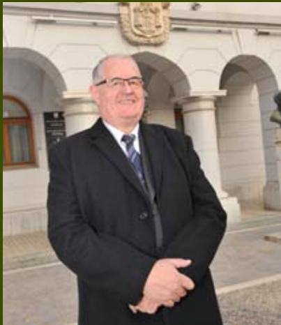
Spoštovane krajanke, cenjeni krajanj KS Grm - Kandija,

vsako leto prinaša nova dejanja, spoznanja, pridobitve in posebne dogodke. Iz skupka vseh pa izluščimo prijetne, ki so motivacija in vzpodbuda za nove zmage in podvige. A tudi neuspešni koraki so pomembni – vzemimo jih kot priložnost za resno analizo in dragoceno izkušnjo za nove