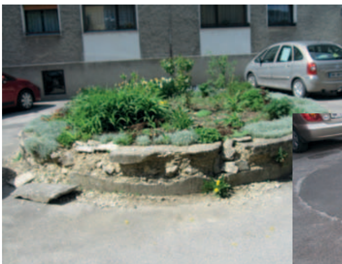
Odstranjen je bil star in razpadajoč zeleni otok v ulici Nad mlini.