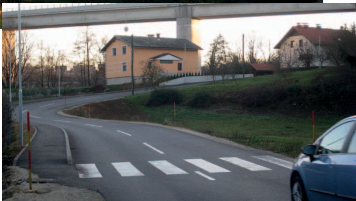
Prenovljen je bil del Smrečnikove ulice.