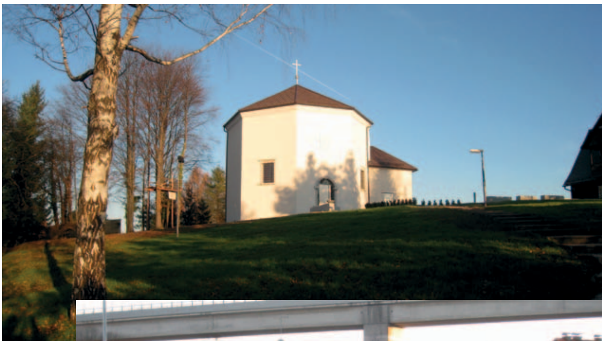
Prenavlja se evangeličanska cerkev na Grmu.