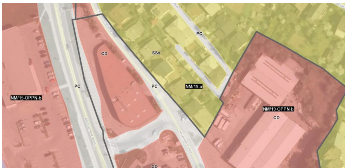
Slika 1: Prikaz namenske rabe prostora in enot urejanja prostora v veljavnem OPN MO Novo mesto.

Predlagani posegi so v enoti urejanja prostora z oznako NM/19-OPPN-b.