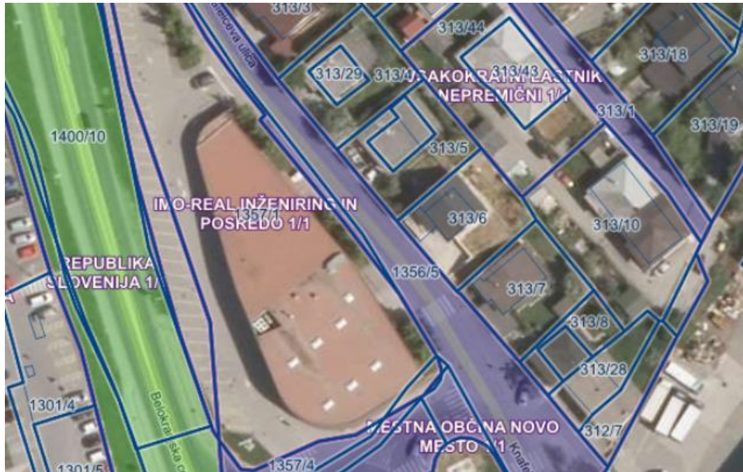
Slika 5: Prikaz lastništva zemljišč.

Območje predvidene prizidave (zemljišči s parcelnima št. 1357/1 in 1357/3, obe k. o. 1482-Ragovo) in objekt Mesnega centra so v lasti investitorja.