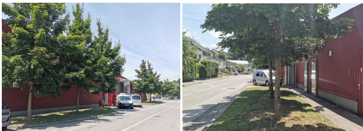
Slika 2: Pogled na lokacijo predvidene dozidave objektu Mesnega centra s Knafelčeve ulice