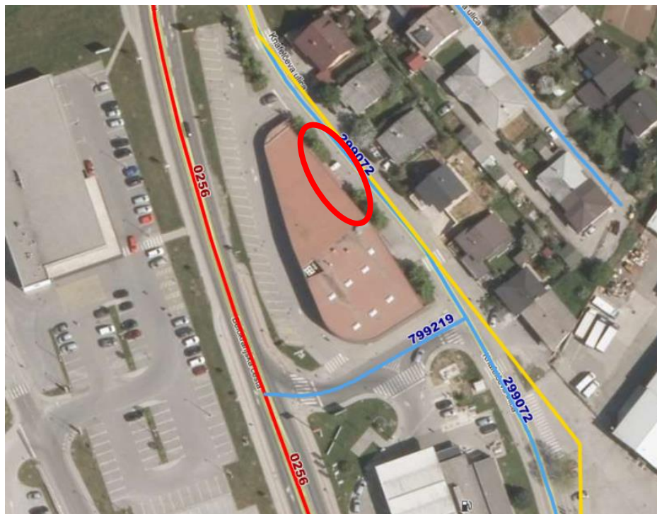
Slika 3: Prikaz prometnic na območju OPPN.

Druga gospodarska javna infrastruktura: Tik ob obravnavanem območju, v koridorju Knafelčeve ulice, potekajo komunikacijski vodi, elektrovi, plinovod, vodovod in kanalizacija. Obstoječi objekt mesnega Centra je priključen na vsa omrežja in naprave GJI, urejeno je odjemno mesto za odvoz smeti.