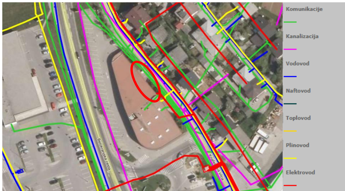
Slika 4: Prikaz obstoječe gospodarske javne infrastrukture.

Druga gospodarska javna infrastruktura: Tik ob obravnavanem območju, v koridorju Knafelčeve ulice, potekajo komunikacijski vodi, elektrovi, plinovod, vodovod in kanalizacija. Obstoječi objekt mesnega Centra je priključen na vsa omrežja in naprave GJI, urejeno je odjemno mesto za odvoz smeti.